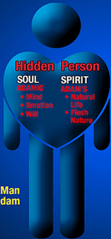
The Old Man in Adam