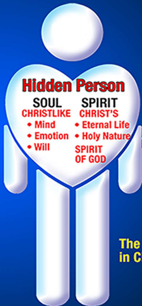
The New Man in Christ