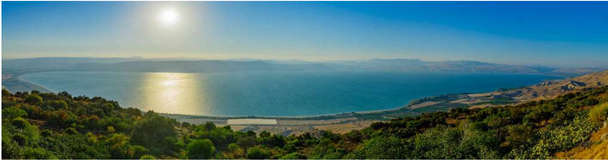
加利利海（革尼撒勒湖、提比哩亚海）